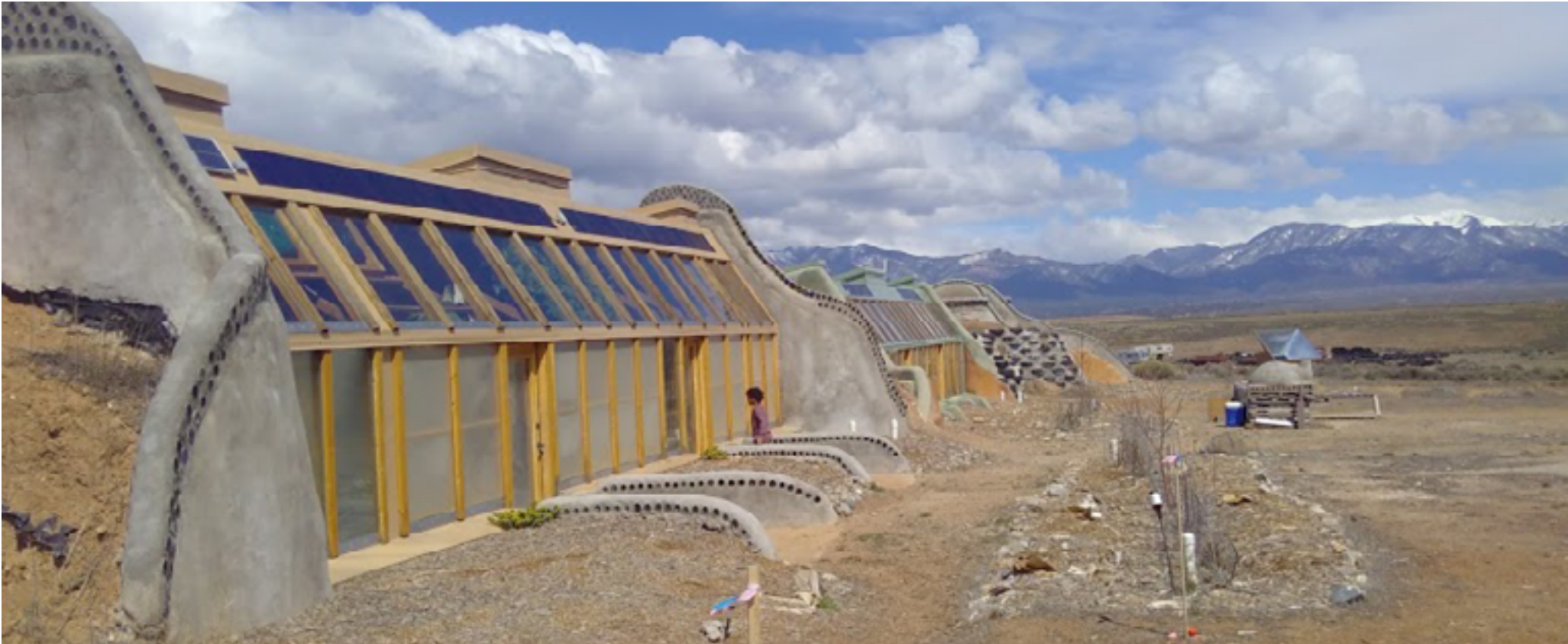
Earthships dans le désert de Taos au Nouveau Mexique

Le Earthship a tendance à provoquer des débats et des émotions intenses. Il possède de nombreux adeptes qui voient dans ce bâtiment