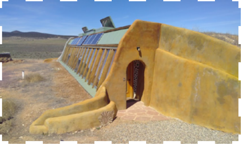
L'architecture peu conventionnelle du Earthship