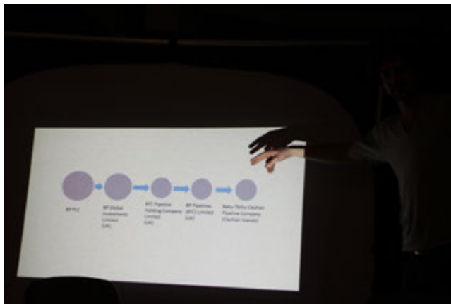
The visible hand of finance / making finance visible

Another example of how opaqueness happens in the financial world: if one makes a visualization of the company BP, it emerges that BP is not one corporate entity, but rather a mother company (BPPLC) that controls a network of scores of subsidiaries which in turn control about a 1000 further subsidiaries.