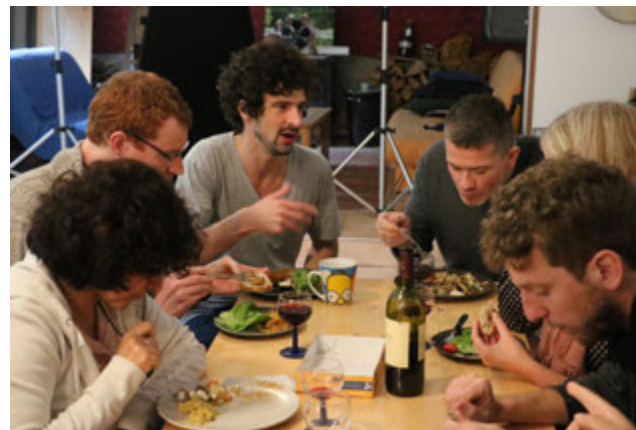
Some of us having lunch at the workshop

What is getting apparent is that the economic and financial systems continually obscure their actual basis in geological and ecological systems, and along with economics putting a price on everything, financial systems take out of the equation environmental destruction as an 'externality'. The depletion and extraction happening on multiple sites around the world for just one corporate entity/network is not taken into account in their way of operating.