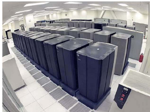
The contemporary, dominant form of money: servers in basements, LINK

This is very powerful and clear: it makes people grasp that the mystification and strategies of opaqueness the finance world resorts to is part and parcel of its strategy to remain elusive and keep operating on the margins of getting sued, i.e. taking to the limit its only mission: to make more money from nothing.